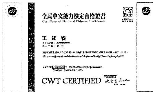
※高、優等證書證號示意圖