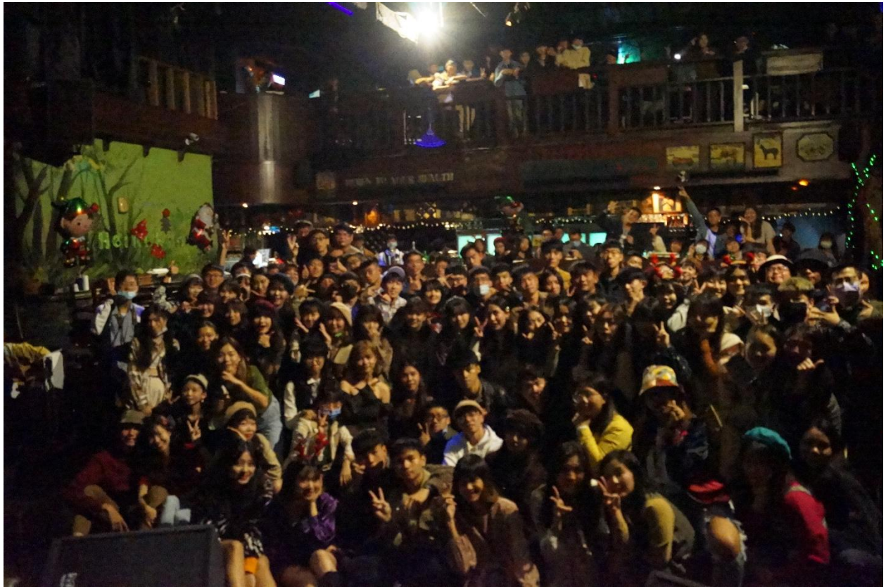
(109年12月21日三系聯合耶誕晚會)