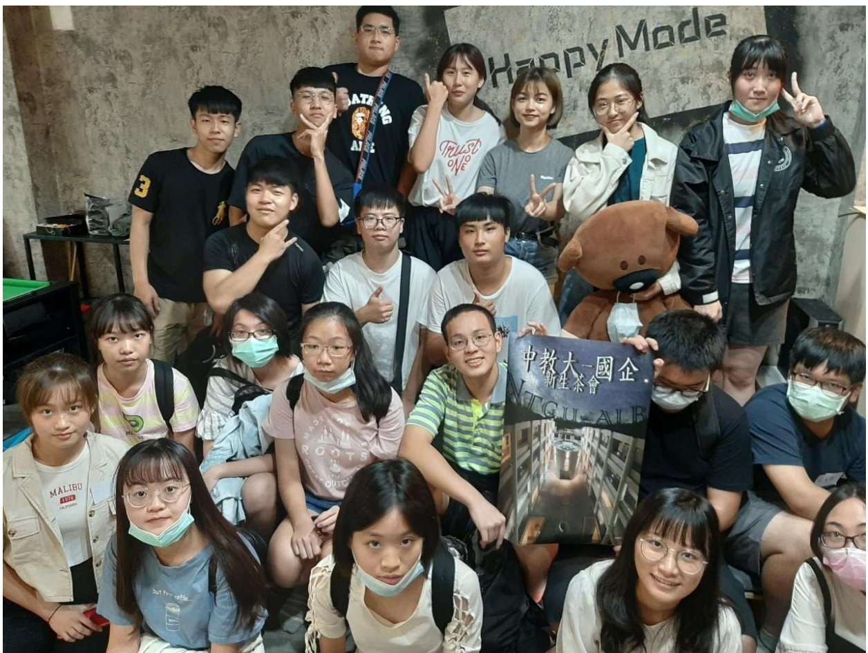
前年中區茶會合照)