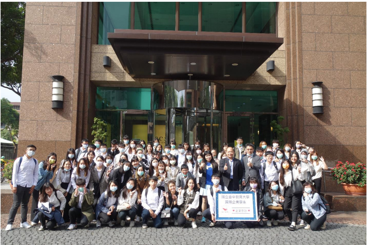
(109年11月3日企業參訪大合照)