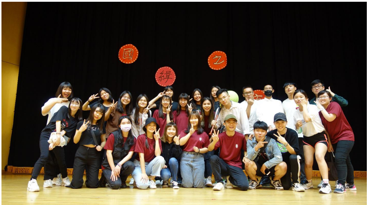
(110年4月27日國企之夜工作人員合照)